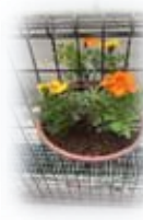
今年も秋まで綺麗に咲いてね