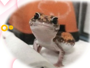
名前: ココ [♀] (ニシアフリカカゲモドキ)

ごはんが欲しくなると、ケージの前に人がいるだけでシェルターから出てくるようになるのですが、『ごはん？ごはん？』といったような顔がたまらなく可愛いです！