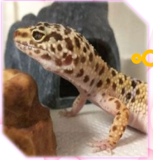
名前: つぶ [♂] (ヒョウモンカゲモドキ)

基本的にはずっと寝てるので、 自慢ポイント はありませんが、ケージの掃除と温度管理をするくらいでお世話が全然難しくありません！ 飼育しやすいペットという点では自慢できます☆